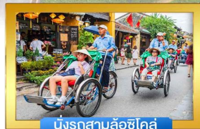
นั่งรถสามล้อซิโคล์