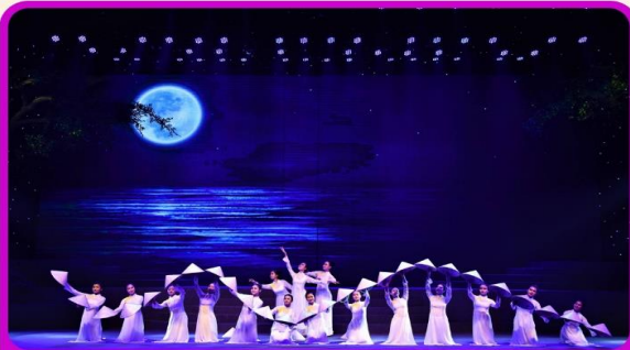
ชมการแสดง Charming Show Danang