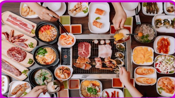
พิเศษ!! เมนูซาซิมิ+บุฟเฟ่ต์ปิ้งย่าง