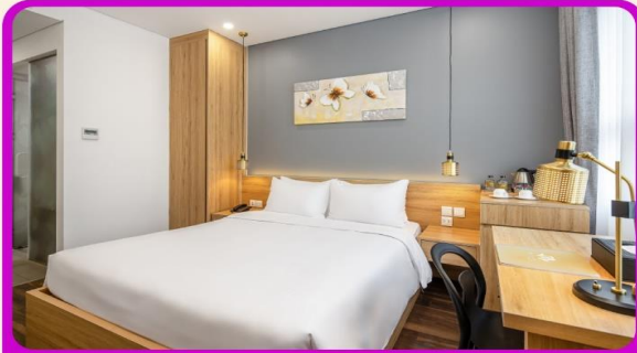
พักเมืองดานัง 4 ดาว 2 คืน