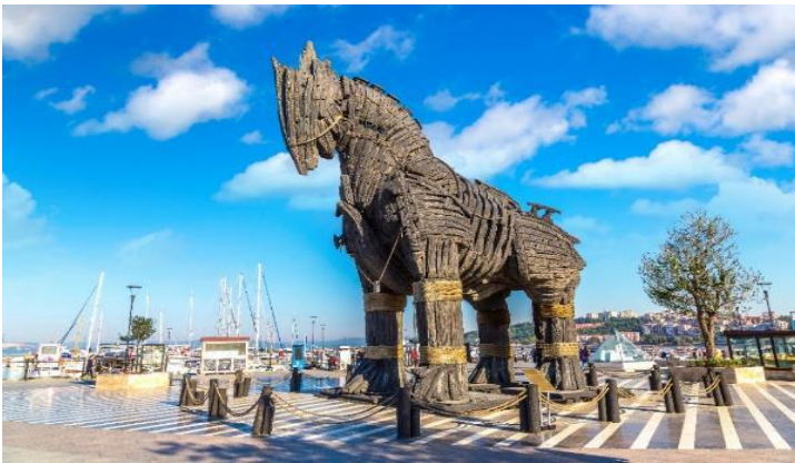
Highlight! บ้านไม้ (Trojan Statue/Hollywood Horse) เป็นที่โด่งดังมาจากภาพยนตร์ฮอลลีวูดเรื่อง ทรอย (Troy) หลังจากนั้นทางทีมงานจึงมอบบ้านไม้จำลองตัวนี้ให้กับทางการตุรเคียเพื่อเป็นเกียรติและสร้างชื่อเสียงให้กับเมืองชานัคคาเล

เช้า 🍷 รับประทานอาหารเช้า ณ โรงแรม (มื้อที่2) นำทุกท่าน เช็คอินแลนด์มาร์คสำคัญ บ้านไม้เมืองทรอย (Troy) หรือ บ้านโทรจัน (Trojan Horse) เป็นม้าขนาดใหญ่ที่ทำมาจากไม้เปรียบเสมือนสัญลักษณ์อันชาญฉลาดด้านศึกของนักรบ โบราณโดยเป็นสาเหตุทำให้กรุงทรอยแตก นำท่านเดินทางสู่ เมืองปามุกคาเล่ (Pamukkale) เมืองแห่งสปา เนื่องจากเป็นพื้นที่ที่มีบ่อน้ำพุร้อนธรรมชาติที่มีชื่อเสียงมาก คำว่า "ปามุกคาเล่" ในภาษาตุรเคีย หมายถึง "ปราสาทปูยฝ้าย" เป็นน้ำตกหินปูนสีขาวที่เกิดขึ้นจากการธารน้ำใต้ดินที่มีอุณหภูมิประมาณ 35 องศาเซลเซียส เที่ยง 🍷 รับประทานอาหารเที่ยง (มื้อที่3)