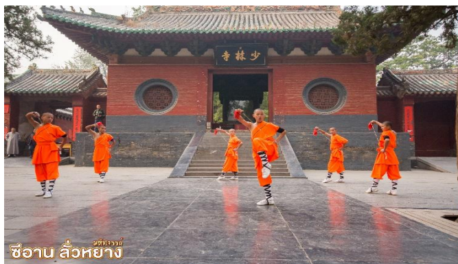
ซีอาบ ลั่วหยาง

เยือน อุทยานป่าเจดีย์ “ถ้ำหลิน” (รวมรถอุทยาน) มีเจดีย์กว่า 200 องค์ ที่มีความเก่าแก่มากกว่า 1,500 ปี เป็นสุสานอดีตของเจ้าอาวาสและหลวงจีนมาตั้งแต่ยุคสมัยของราชวงศ์ถัง