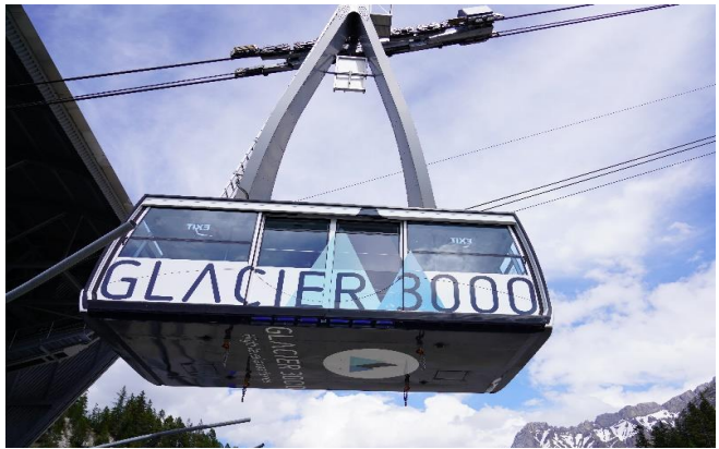
Highlight ! กระเช้าไฟฟ้าขนาดยักษ์ที่จุผู้โดยสารได้ถึง 125 คน

เช้า ๑๐ รับประทานอาหารเช้า ณ โรงแรม (มื้อที่2) นำท่านเดินทางสู่ หมู่บ้านโคล เดอ ปียง (Col De Pillon) เป็นที่ตั้งของสถานี นำท่านนั่งกระเช้าลอยฟ้า สู่ ยอดเขากลาเซียร์ 3000 (Glacier 3000) มีความสูงเกือบ 3,000 เมตรเหนือระดับน้ำทะเล ชมทิวทัศน์อันงดงามของท้องฟ้าและเทือกเขามากมายแบบพาโนรามา และให้ท่านท้าทายความสูงเดินบน "The Peak Walk by Tissot" สะพานแขวนที่มีความยาว 107 เมตรข้ามหน้าผาที่ระดับความสูง 3,000 เมตร ทำให้เป็นสะพานแขวนที่สูงที่สุดในโลก