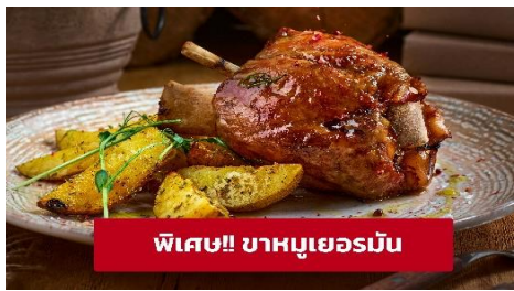
พิเศษ!! ขาหมูเยอรมัน

เที่ยง ๑๐ รับประทานอาหารเที่ยง (มื้อที่3) เมนูพิเศษ! ขาหมูเยอรมัน จากนั้นนำท่านเดินทางสู่ เมืองซาลซ์บูร์ก (Salzburg) ประเทศออสเตรีย (ระยะทาง 214 กม. / 3.15 ชม.) มีวิวทิวทัศน์สวยงามเป็นเอกลักษณ์ เนินภูเขาหิมะ สลับทะเลสาบตลอดเส้นทาง จากนั้นนำท่านชม สวนมิราเบล (Mirabell garden) สวนดอกไม้สไตล์ฝรั่งเศส ที่ได้ชื่อว่าสวยงามที่สุดในออสเตรีย ตั้งอยู่ภายในพระราชวังมิราเบล ภายในตกแต่งและออกแบบอย่างเป็นสัดส่วนในรูปแบบเรขาคณิตสไตล์บาโรก และแต่งด้วยพันธุ์ไม้หลากสี