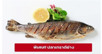
พิเศษ!! ปลาเทราต์ย่าง

เที่ยง ๑๑ รับประทานอาหารกลางวัน (มื้อที่3) เมนูพิเศษ ปลาเทราต์ย่างท่านละ 1 ตัว นำท่านเดินทางสู่ เมืองมิวนิก (Munich) ประเทศเยอรมัน (ระยะทาง 209 กม./ 3 ชม.) เป็นหนึ่งในเมืองมั่งคั่งที่สุดของยุโรป มีพรมแดนติดเทือกเขาแอลป์ พาทุกท่านไปเช็คอินสถานที่ชื่อดังที่มีความสำคัญของเมืองมิวนิก