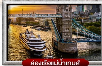
ล่องเรือแม่น้ำเทมส์