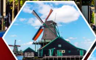
หมู่บ้านกังหันลม ชานส์คินส์