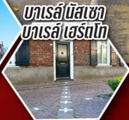
บารเล่ นิสซา บารเล่ เฮอร์โตโก