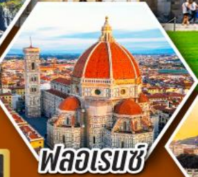
ฟลอเรนซ์