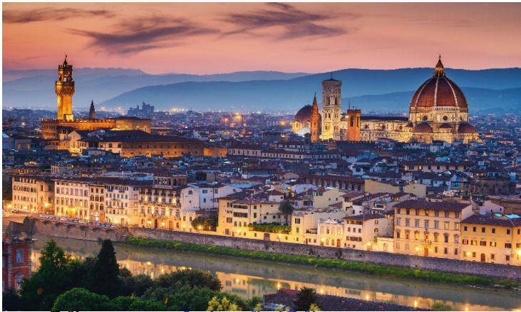
ที่พิทัก

พิธิเจมน์น้ำมนต์ (Baptistry of St. John) ที่ใหญ่ที่สุดในอิตาลี, มหาวิหารดูโอโม (Duomo) ที่งดงาม และหอเอนแห่งเมืองปิซ่าอันเลื่องชื่หออเอนปิซ่า (Leaning Tower of Pisa) สัญลักษณ์แห่งเมืองปิซ่า 1 ใน 7 สิ่งมหัศจรรย์ของโลกยุคกลาง เริ่มสร้างเมื่อปี ค.ศ.1173 ใช้เวลาสร้างประมาณ 175 ปี แต่ระหว่างการก่อสร้างต้องหยุดชะงักลงไปเมื่อสร้างไปได้ถึงชั้น 3 ก็เกิดการยุบตัวของฐานขึ้นมา และต่อมาก็มีการสร้างหอดต่อเติมขึ้นอีกจนแล้วเสร็จ โดยใช้เวลาสร้างทั้งหมดถึง 177 ปี โดยที่หอเอนปิซ่านี้ กาลิเลโอ บิดาแห่งวิทยาศาสตร์ ซึ่งเป็นชาวอิตาเลียนได้ใช้เป็นสถานที่ทดลองทฤษฎีแรงโน้มถ่วงของโลกที่ว่า สิ่งของสองชิ้น น้ำหนักไม่เท่ากัน ถ้าปล่อยสิ่งของทั้งสองชิ้นจากที่สูงพร้อมกัน ก็จะตกลงพื้นพร้อมกัน จากนั้นให้ท่านอิสระให้ท่านได้เลือกซื้อสินค้าที่ระลึกราคาถูก ที่มีร้านค้าเรียงรายอยู่มาก