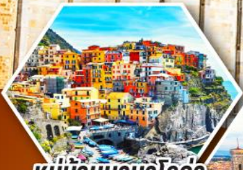
หมู่บ้านมานาโรล่า