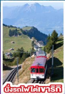
นั่งรถไฟใต้เทวริก