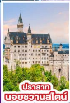
ปราสาท บอยชวานส์ไนด์