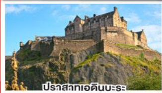
ปราสาทเอดินบะระ