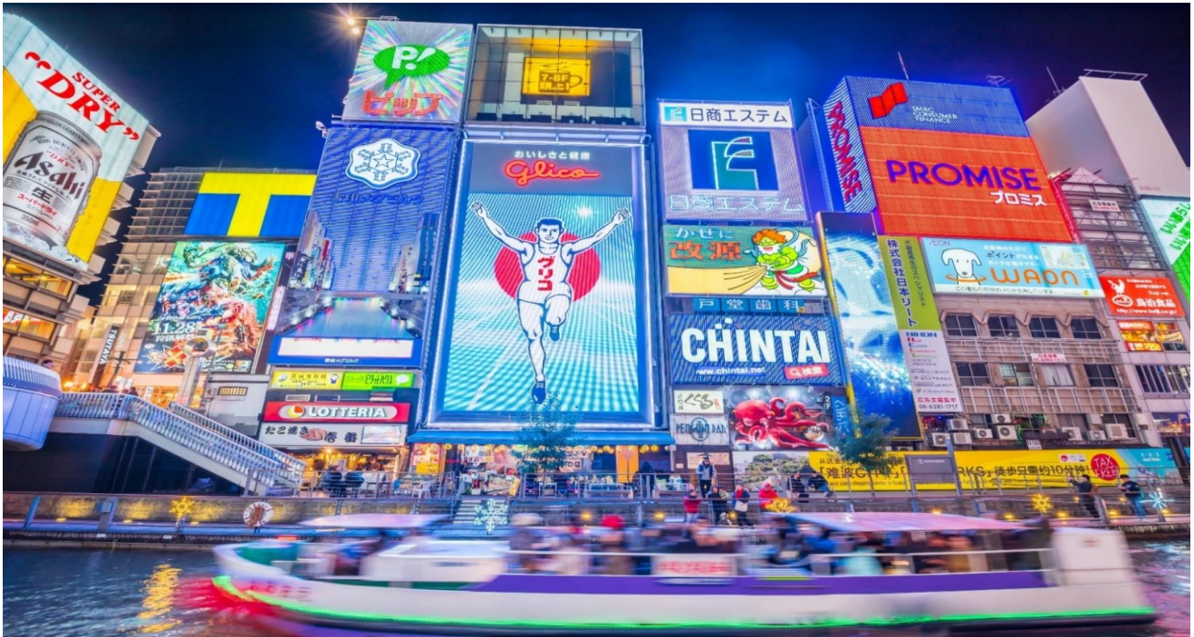
คำ อิสระอาหารตามอัยาศัยเพื่อสะดวกแก่การช้อปปิ้ง ที่พัก SUN WHITE HOTEL, OSAKA หรือเทียบเท่า