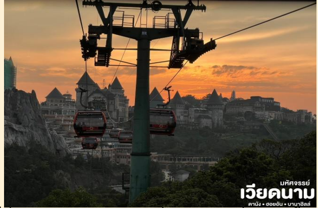
มหิศวรรษย์ เวียดนาม ดานัง • ฮอยอัน • บาน่าฮิลล์

นั่งกระเช้าขึ้นสู่บาน่าฮิลล์ กระเช้าแห่งบาน่าฮิลล์นี้ได้รับการบันทึกสถิติโลกโดย World Record ว่าเป็นกระเช้าไฟฟ้าที่ยาวที่สุด ประเภท Non Stop โดยไม่หยุดแวะมีความยาวทั้งสิ้น 5,042 เมตร และเป็นกระเช้าที่สูงที่สุด 1,294 เมตร นักท่องเที่ยวจะได้สัมผัสสวยเมฆหมอกและบางจุดมีเมฆลอยต่ำกว่ากระเช้าพร้อมอากาศบริสุทธิ์อันสดชื่นจนทำให้ท่านอาจลืมไปเสียด้วยซ้ำว่าที่นี่ไม่ใช่ยุโรปเพราะอากาศที่หนาวเย็นเฉลี่ยตลอดทั้งปีประมาณ 10 องศาเท่านั้น