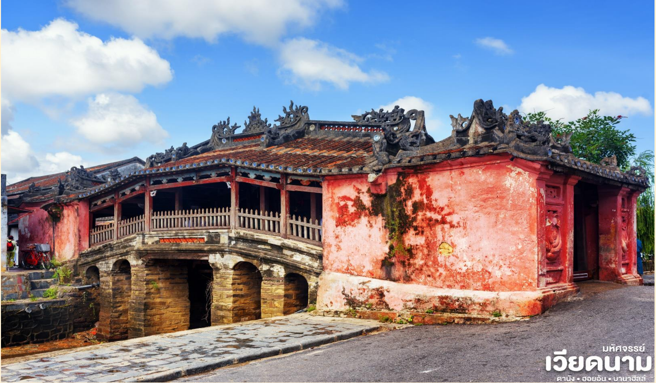
นทีศรชัย เวียดนาม ดานัง • ฮอยอัน • บานาฮิลล์

BT-DAD22_FD_APR-OCT 2025 DANANG HOIAN BANAHILLS (พักนานาชาติ 2 คืน)