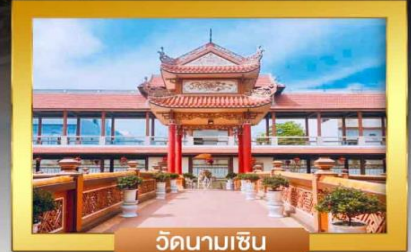
วัดนามเชิน