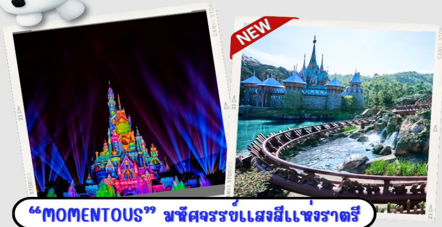
“MOMENTOUS” มหึศจรรย์แห่งแสงสีแห่งราตรี