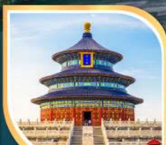
หอฟ้าเทียนถาน