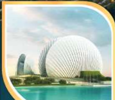
โรงละครหอยโข่ง