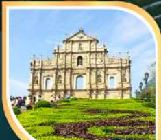
วิหารเซนต์ปอล