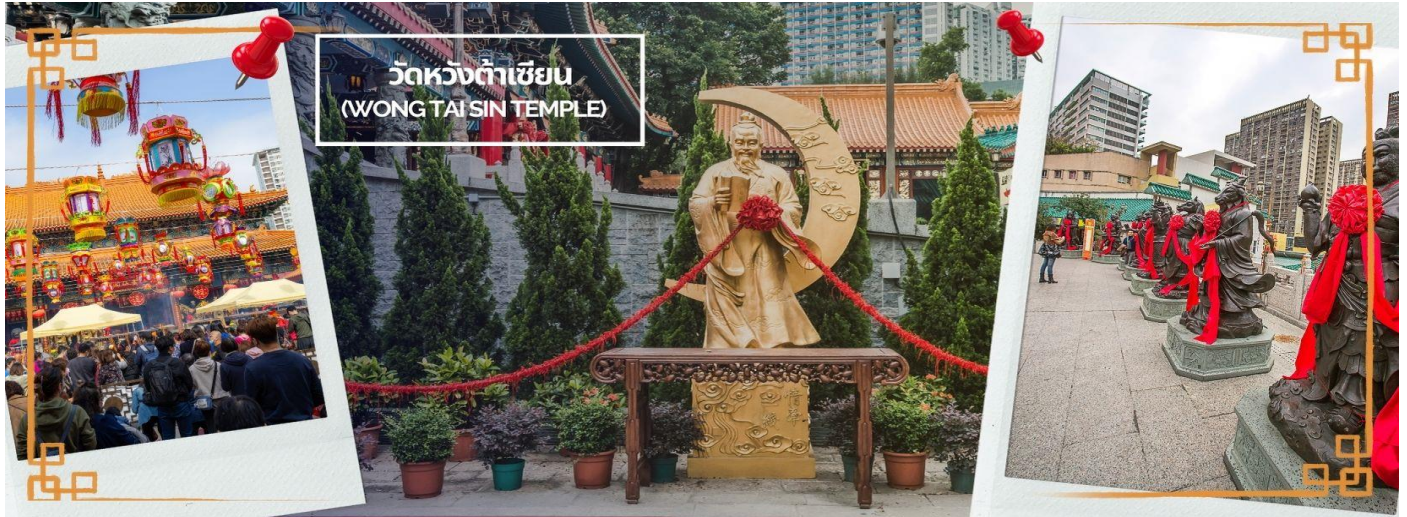
วัดหวังต้าเซียน (WONG TAI SIN TEMPLE)

ภายใต้แสงจันทร์ เป็นเทพเจ้าผู้เป็นอมตะที่อาศัยอยู่บนดวงจันทร์ และลงมาโลกมนุษย์เพื่อผูกด้วยดวงชะตา ระหว่างคู่รักซึ่งเมื่อคู่กันแล้วก็จะไม่แคล้วคลาดกัน