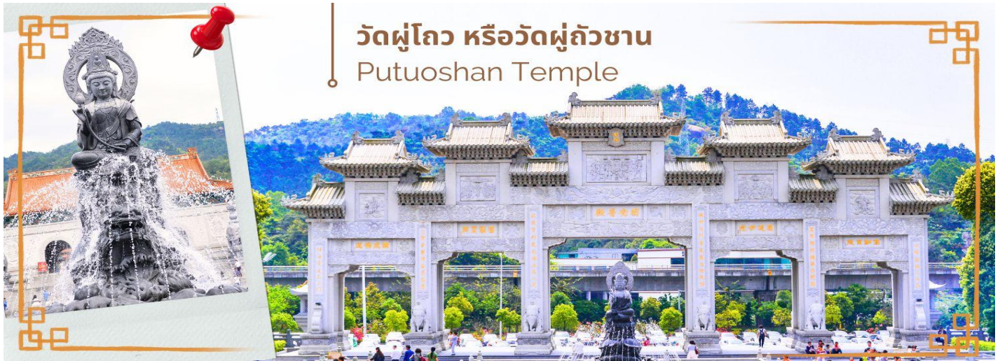
วัดผู้ไถว หรือวัดผู้ถัวซาน Putuoshan Temple

จากนั้นนำท่านสู่ วัดผู้ไถว หรือวัดผู้ถัวซาน (Putuoshan Temple) ดินแดนอันศักดิ์สิทธิ์ ของพระโพธิสัตว์กวนอิม พุทธศาสนิกายมหายาน พระโพธิสัตว์กวนอิมคืออวตารหนึ่งของพระอมิตาภพุทธเจ้า ซึ่งพระโพธิสัตว์กวนอิม เป็นมหาบุรุษมีวัฒนธรรมโดยรวมกว้างขวางและออกแบบด้วยรูปแบบสถาปัตยกรรมโบราณแบบดั้งเดิม