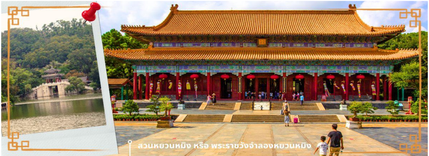
สวนหยวนหมิง หรือ พระราชวังจำลองหยวนหมิง

คู่รัก และที่เรียกว่าถนนคู่รักเพราะว่าภายในบริเวณถนนริมชายหาดแห่งนี้ ได้มีการนำเก้าอี้ หรือ ม้านั่ง ซึ่งทำมาสำหรับ 2 คนเท่านั้น จึงตั้งชื่อว่า ถนนคู่รัก จากนั้นนำท่านสู่ ร้านหยก หยกในจินโบราณจนมาถึงสมัยนี้ ยังมีความเชื่อว่าเป็นอัญมณีที่ล้ำค่าและหายาก บ่งบอกฐานะของสตรีในสมัยก่อน แต่ในสมัยนี้ เชื่อกันว่าหยกสีเขียวมันเหนียวนำโชคและความร่ำรวย ดังคำกล่าวที่ว่า“สีเขียวเหนียวทรัพย์” ถือเป็นการเสริมฮวงจุ้ยที่ดีของผู้สวมใส่อิสระให้ท่านได้เรียนรู้ชนิดของหยกและเลือกซื้อตามใจชอบจากนั้นนำท่านสู่ สวนหยวนหมิง หรือ พระราชวังจำลองหยวนหมิง ตั้งอยู่ ณ ใจกลางหุบเขาซิลิน เมืองจูไห่ สร้างขึ้นเลียนแบบพระราชวังหยวนหมิง ณ กรุงปักกิ่ง สิ่งก่อสร้างต่างๆ มากกว่า 100 ชิ้น มีขนาดเท่าของจริงในอดีตทุกชิ้น อาทิ เสาหินคู่สะพานข้ามธารทอง ประตูตึกง ตำหนักเจิ้งตำกวางหมิง สะพานเก้าอี้แว่น สวนแห่งนี้โอบล้อมด้วยขุนเขาที่เขียวชอุ่ม และมีพื้นที่ครอบคลุมทะเลสาบขนาดมหึมา ซึ่งมีขนาดเท่ากับสวนเดิมในกรุงปักกิ่ง และยังมีการเพิ่มเติมและตกแต่งสวนที่เป็นศิลปะแบบตะวันตกผสมกับศิลปะจีน