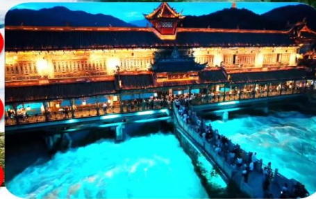
เมืองโบราณตูเจียงเยี่ยน