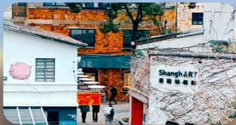
M50 เอ็มอู้อีชองอี่ทยวน