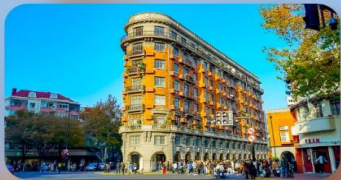
ถนนอันฟู่