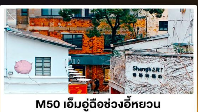
M50 เอ็มอู๊วอวอฮยวน