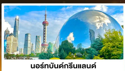
นอร์มบัณฑิตกรีนแลนด์