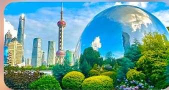
นอร์มัลคันทรีแลนด์