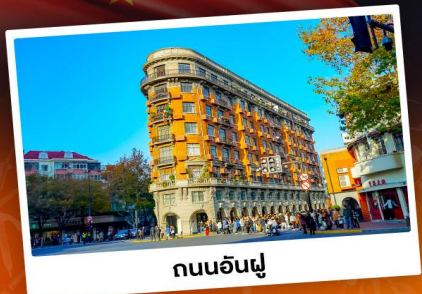
ถนนอันฟู