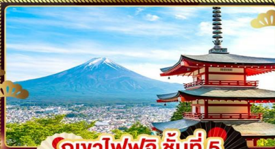
ภูเขาไฟฟูจิ ชั้นที่ 5

ชมลาวเอนเดอร์ ที่ สวนโออิชิปาร์ค อิสระ 1 DAY TRIP