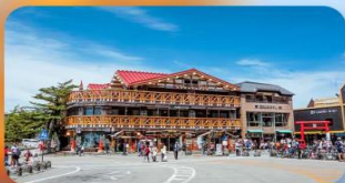
ภูเขาไฟฟูจิ ชั้นที่ 5