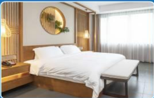
👤👤 DOUBLE (DBL)