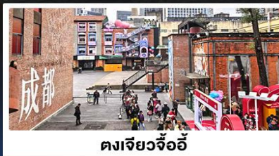
ตงเจียวจื้ออี้