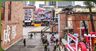
ตงเจียวจื่ออี้