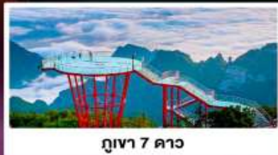
ภูเขา 7 ดาว