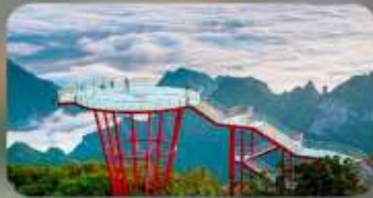
ภูเขา 7 ดาว