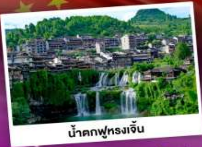
น้ำตกฟูหลงเจิน

เที่ยวชมหมู่บ้านโบราณริมน้ำตก "ฟูแรงเจิน" นั่งกระเช้าขึ้นสู่อุทยาน ภูเขาเจ็ดดาว