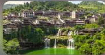
หมู่บ้านโบราณฟุหรงเจิน