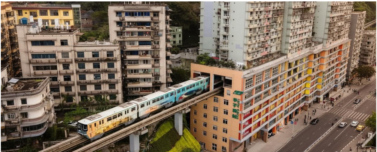
บ่าย นำท่านแวะเช็คอิน สถานีรถไฟฟ้าทะเลตุ๊ก (Liziba Station) ชมภาพรถไฟฟ้าวิ่งทะเลตุ๊กกลางอาคารพักอาศัยอย่างกลมกลืน ขบวนแล้วขบวนเล่าที่แล่นผ่านไปอย่างแม่นยำไร้เสียงรบกวน กลายเป็นสัญลักษณ์

2UCKG-CZ005 บินตรงฉงชิ่ง ฟรีคอม ฟรีเคย์ สนุกสุดคุ้ม มหานครแปดมิติ 5 วัน 3 คืน โดยสายการบิน ไชน่า เซาเทิร์น (CZ)