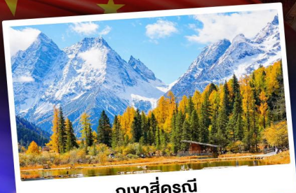
กู๋เงาสีดรุณี

ชมบรรยากาศใบไม้เปลี่ยนสี "สถานที่ท่องเที่ยว 5A อุทยานจิ๋วจ้ายโกว"