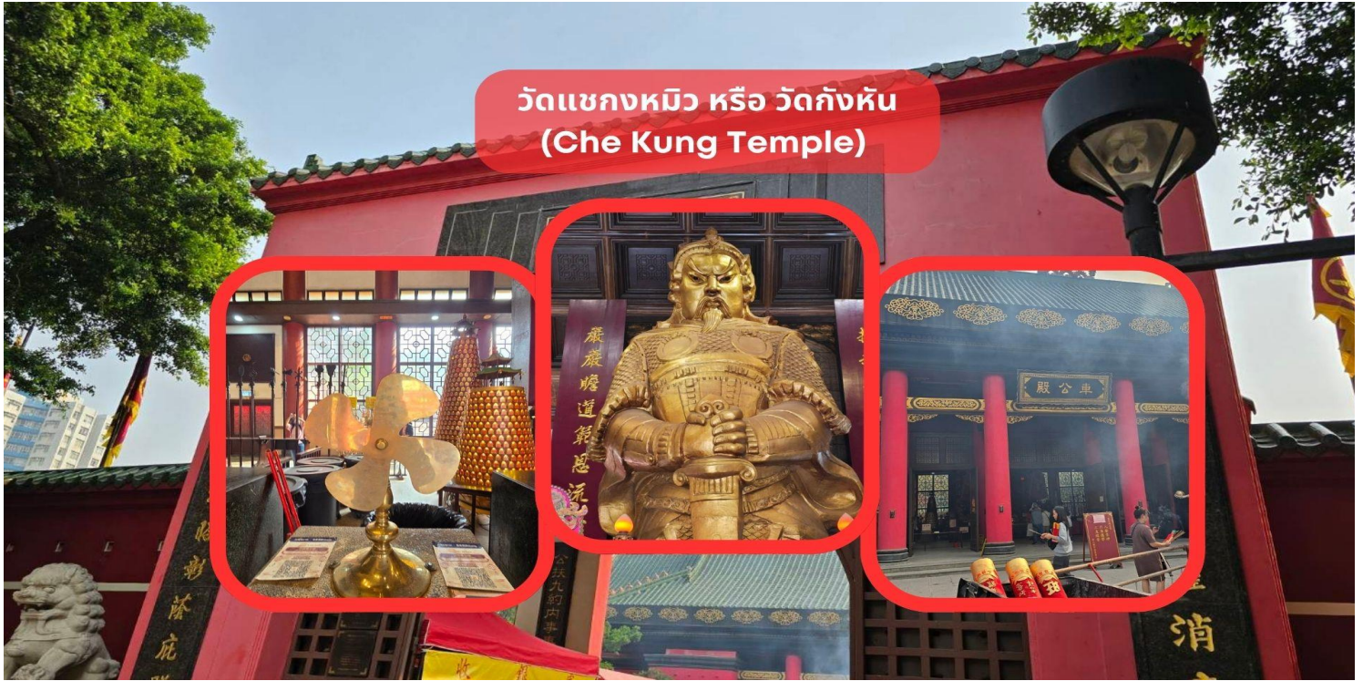
วัดแขกหมิว หรือ วัดกั๊งหัน (Che Kung Temple)

จากนั้นนำท่านเดินทางสู่ วัดแขกหมิว หรือ วัดกั๊งหัน (Che Kung Temple) ขอพรเรื่องการเดินทางปลอดภัย สุขภาพแข็งแรง โชคลาภ และเงินทอง วัดตั้งฮ่องกงที่ตั้งมาถึงเมืองไทย เป็นวัดที่มีประวัติศาสตร์ยาวนานกว่า 300 ปี ภายในวัดมีรูปปั้นสี่ทองเหลืองอร่าม ตั้งตระหง่านทั้งชายและขวา เป็นวัดศักดิ์สิทธิ์ที่มีความเชื่อในเรื่องกั๊งหันลม โดยความหมายของใบพัดทั้ง 4 คือ เดินทางปลอดภัย อายุยืนยาว เงินทองไหลมาเทมา และสมปรารถนาทุกประการ หากหมุนกั๊งหันตามเข็มนาฬิกา 3 รอบ จะพัดพาเอาสิ่งไม่ดีออกชีวิต และนำสิ่งดีๆ เข้ามาแทน