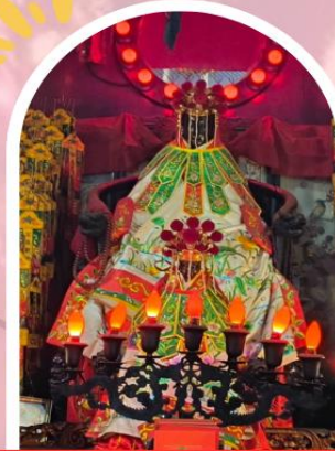
วัดเจ้าแม่กวนอิมฮ่องฮำ ขอพรเรื่องเงิน ทรัพย์สิน และความมั่งคั่ง