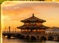
สะพานจันเฉียว