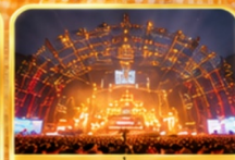
สถานที่จัดงาน เทศกาลเบียร์ชิงเต่า