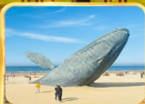
ประติมากรรมวาฬเพทายต้น