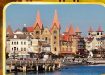
ท่าเรือชาวประมง