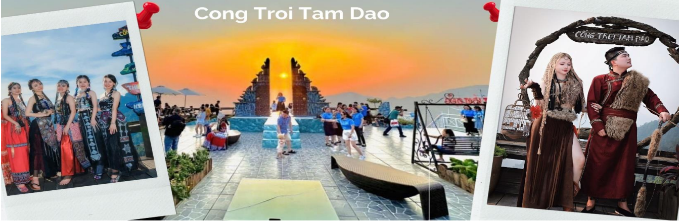
Cong Troi Tam Dao

นำท่านชม ร้านกาแฟ Cong Troi Tam Dao คือหนึ่งในจุดเช็คอินที่โดดเด่นที่สุดในเมืองตามด้าวตั้งอยู่บนยอดเนินเขาที่สามารถมองเห็นวิวเมืองตามด้าวได้ทั้งเมือง สถาปัตยกรรมที่นี่ มีกลิ่นอายแบบยุโรปคลาสสิกด้วย ชุมประตุนหิน ทรงโค้งที่ตั้งตระหง่านอยู่ริมหน้าผา เปรียบเสมือนกรอบรูปขนาดยักษ์ที่ล้อมรอบทิวทัศน์ของขุนเขาและทะเลหมอกเอาไว้ โดยเฉพาะในช่วงเช้าและช่วงเย็นที่หมอกจะไหลผ่านชุมประตุนหิน ทำให้บรรยากาศดูลึกลับ