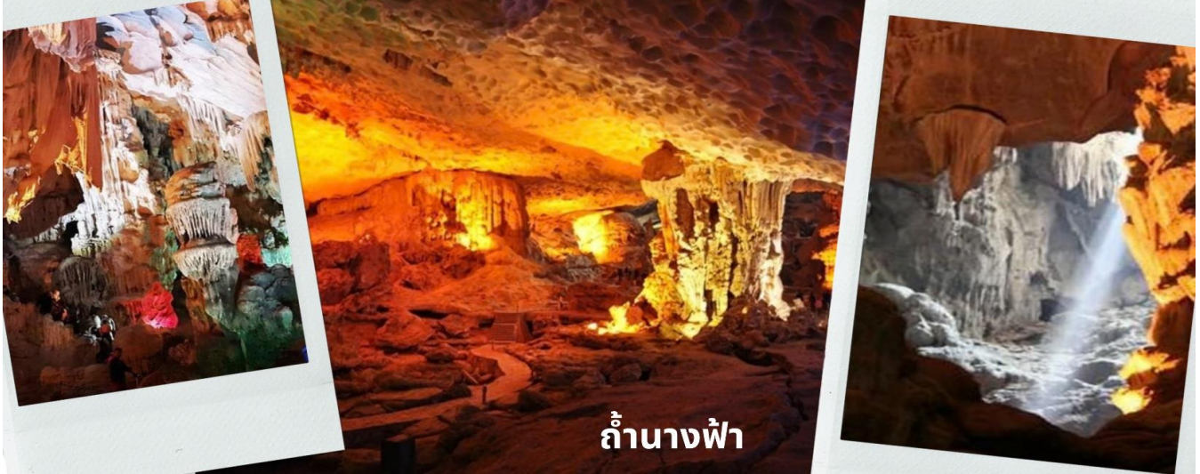
ถ้ำนางฟ้า

จะเห็นได้ว่าหินงอกหินย้อยต่าง ๆ นั้นจะมีลักษณะรูปทรงแตกต่างกันออกไปตามแต่ท่านจะจินตนาการ ขึ้นอยู่ว่าแต่ละท่านจะตีความออกมาว่าเป็นรูปทรงเหมือนสิ่งใด ในถ้ำเราจะเห็นหินรูปนางฟ้าที่ถูกสร้างขึ้นมาจากทางธรรมชาติที่ติดอยู่ภายในผนังถ้ำ นับว่าเป็นสิ่งมหัศจรรย์อย่างหนึ่งและมีตำนานเล่าขานกันว่า มีเหล่านางฟ้าเข้ามาอาบน้ำในถ้ำแห่งนี้และเกิดหลงไหลชายหนุ่มผู้ที่เป็นมนุษย์เลยคิดที่จะไม่อยากจะกลับสวรรค์ จนกระทั่งเวลาผ่านไปถ้ำเลยไปกลุ่มนางฟ้าทั้งหลายเลยกลายเป็นหินติดอยู่ที่ผนังถ้ำอย่างน่าอัศจรรย์