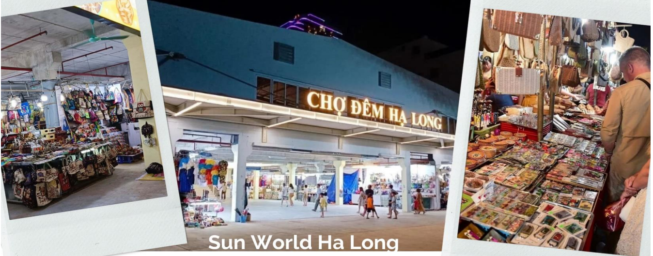
Sun World Ha Long

จากนั้นนำท่านไป ตลาดกลางคืนฮาลอง ไม่เพียงแต่เป็นสวรรค์แห่งอาหารและการช้อปปิ้งเท่านั้น แต่ยังเป็นสถานที่ที่เก็บรักษาจิตวิญญาณทางวัฒนธรรมของดินแดนแห่งมรดกโลกกว้างนิญอีกด้วย ที่นี่ นักท่องเที่ยวจะได้สัมผัสกับบรรยากาศที่คึกคัก ลิ้มลองอาหารท้องถิ่นรสเลิศ และเลือกซื้อของที่ระลึกที่สะท้อนถึงความเป็นทะเลอย่างแท้จริง ทุกมุมของตลาดล้วนซ่อนเร้นเสน่ห์อันเป็นเอกลักษณ์ – ตั้งแต่กลิ่นหอมเย้ายวนของอาหารปิ้งย่าง เสียงจอแจของการซื้อขาย ไปจนถึงแสงไฟระยิบระยับที่สะท้อนบนพื้นถนนยามค่ำคืน