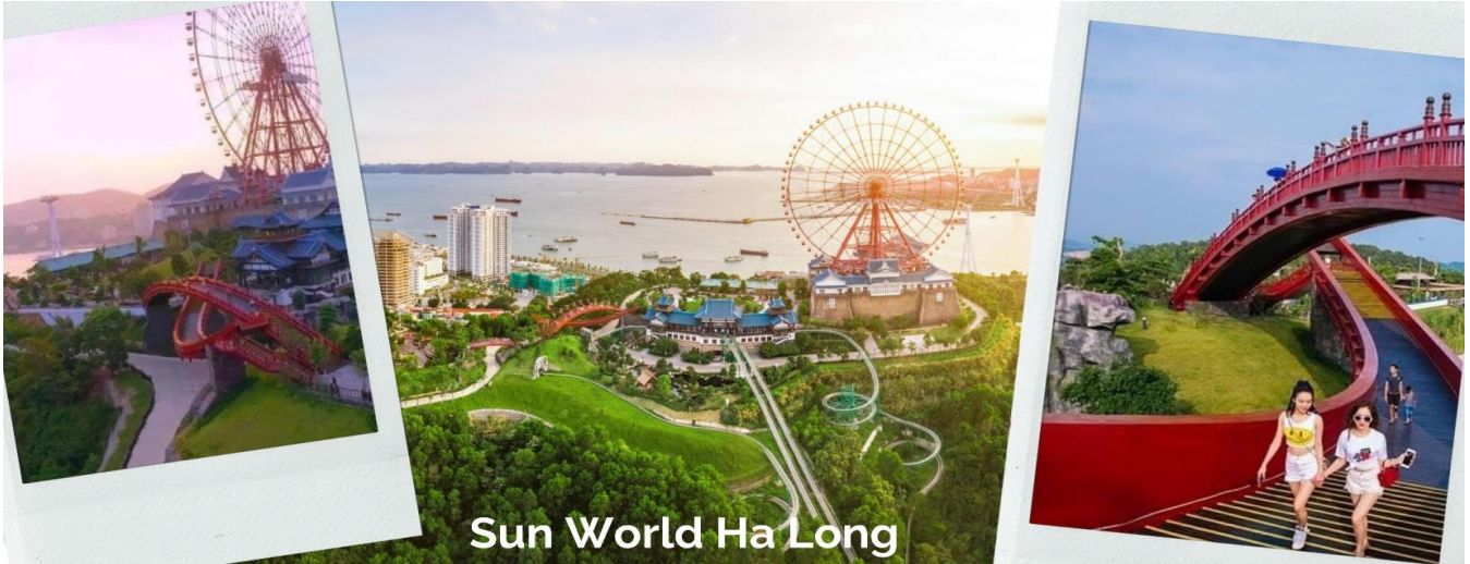
Sun World Ha Long

ที่นี่ก็คือ การนั่งชิงช้าสวรรค์ Sun Wheel ไปชมสวนญี่ปุ่น นั่งชมวิวนครทะเล Queen Cable Car และเล่นที่สวนน้ำ Typhoon Wate