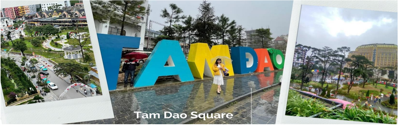
Tam Dao Square

นำท่านสู่ จัตุรัสตามด้าว ตั้งอยู่ใจกลางเมือง โดดเด่นด้วยน้ำพุขนาดใหญ่ รายล้อมไปด้วยร้านค้า ร้านอาหาร โรงแรม และคาเฟ่มากมาย บางวันมีการแสดงดนตรีสดให้ได้ชม บรรยากาศคึกคักมาก และไฮไลท์ที่พลาดไม่ได้ก็คือ ป้ายขนาดใหญ่ที่เขียนว่า “ Tam Dao ” เป็นจุดที่นักท่องเที่ยวนิยมมาถ่ายรูปกัน ถือเป็นการเช็คอินว่ามาถึงตามด้าวแล้ว