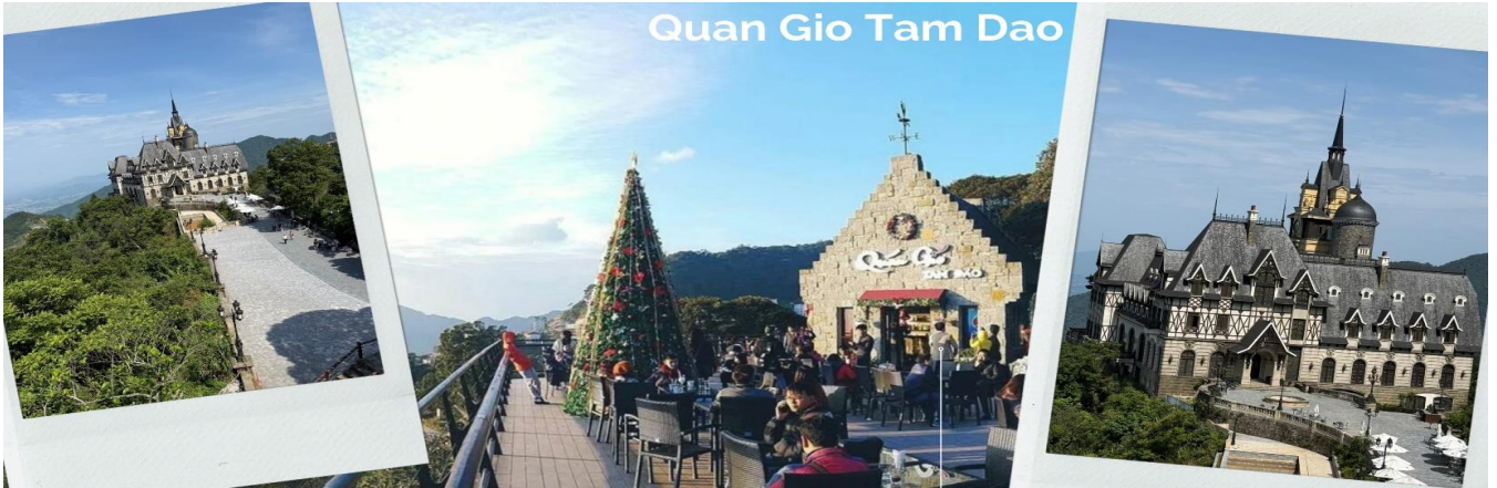
Quan Gio Tam Dao

นำท่านไปชมวิวยอดเยี่ยมกันที่ สะพานเมฆตามด้าว เป็นหนึ่งในจุดถ่ายรูปและจุดชมวิวยอดนิยม โดยเป็นสะพานไม้สูง 20 เมตร ทอดยาวเป็นทางเดินออกไปบนไหล่เขาในระยะทาง 50 เมตร เชื่อมภูเขาเล็กๆ สองลูกเข้าด้วยกัน สามารถเพลิดเพลินไปกับทัศนียภาพอันงดงามของหุบเขาเขียวขจี เมฆขาวลอยฟุ้ง สัมผัสถึงความเงียบสงบและความงดงามของสถานที่แห่งนี้ เมื่อเวลาที่มีทะเลหมอกจะเหมือนกับว่าได้เดินอยู่ท่ามกลางเมฆจริงๆ บอกเลยว่าบรรยากาศดีมากๆ จากนั้นนำท่านสู่สถานอวย (ใช้ระยะเวลาประมาณ 1 ชม 30 นาที)