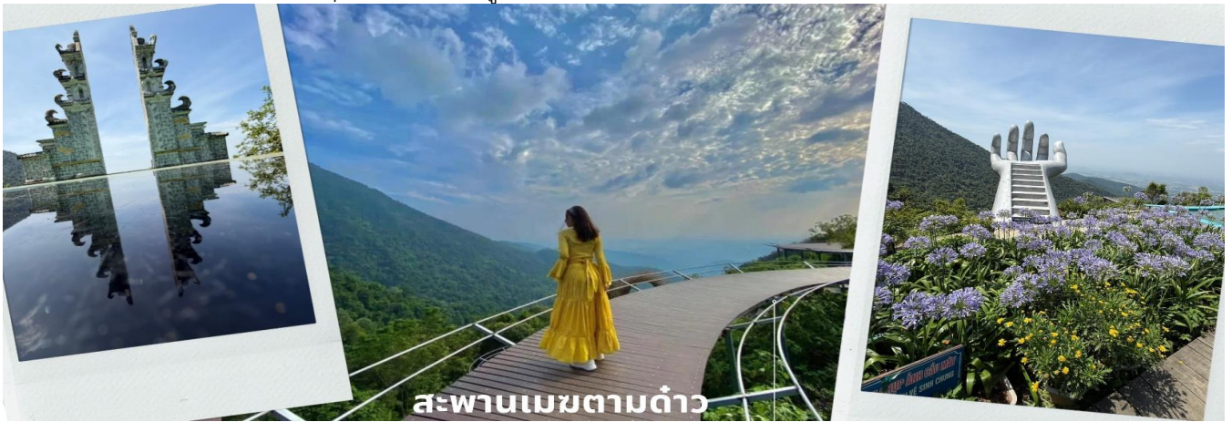
สะพานเมฆตามด้าว

นำท่านไปชมวิวยอดเยี่ยมกันที่ สะพานเมฆตามด้าว เป็นหนึ่งในจุดถ่ายรูปและจุดชมวิวยอดนิยม โดยเป็นสะพานไม้สูง 20 เมตร ทอดยาวเป็นทางเดินออกไปบนไหล่เขาในระยะทาง 50 เมตร เชื่อมภูเขาเล็กๆ สองลูกเข้าด้วยกัน สามารถเพลิดเพลินไปกับทัศนียภาพอันงดงามของหุบเขาเขียวขจี เมฆขาวลอยฟุ้ง สัมผัสถึงความเงียบสงบและความงดงามของสถานที่แห่งนี้ เมื่อเวลาที่มีทะเลหมอกจะเหมือนกับว่าได้เดินอยู่ท่ามกลางเมฆจริงๆ บอกเลยว่าบรรยากาศดีมากๆ จากนั้นนำท่านสู่สถานอวย (ใช้ระยะเวลาประมาณ 1 ชม 30 นาที)