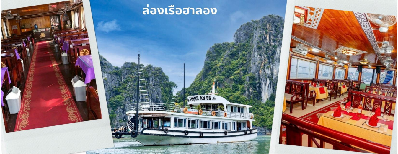
ล่องเรือฮาลอง

เช้า รับประทานอาหารเช้า ณ ห้องอาหารของโรงแรม (7) ท่าน ล่องเรือชมอ่าวฮาลองเบย์ ที่มีพื้นที่กว้างใหญ่กว่า 1,500 ตารางกิโลเมตร อยู่ทางตอนเหนือของเวียดนาม และเป็นส่วนหนึ่งในอ่าวตังเกี๋ย มีชายฝั่งยาวเป็นระยะทางกว่า 120 กิโลเมตร ท่านจะพบกับวิวทิวทัศน์ หันมองไปทางไหนก็สวยงาม เห็นผืนน้ำสีเขียวสวยและหมู่เกาะหินปูนน้อยใหญ่โผล่ขึ้นมาจากผืนน้ำทะเลที่มีลักษณะแตกต่างกันออกไป ถือเป็นสถานที่เที่ยวชมธรรมชาติของเวียดนามอีกแห่งหนึ่งที่สามารถดึงดูดนักท่องเที่ยวมากมายจากทั่วทุกมุมโลกให้มาเยือนสถานที่แห่งนี้