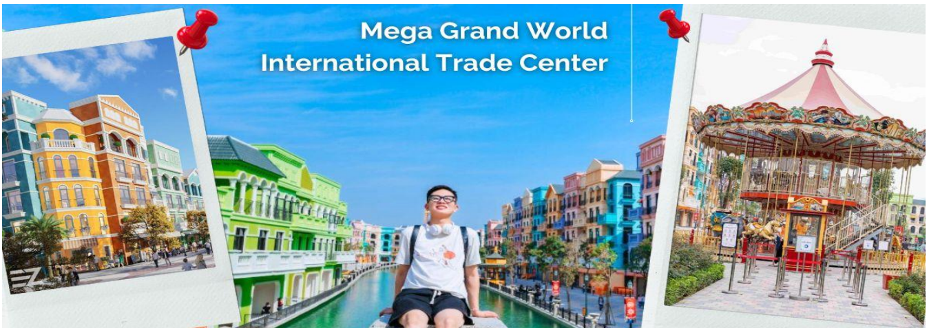
Mega Grand World International Trade Center

เช้า รับประทานอาหารเช้า ณ ห้องอาหารของโรงแรม (10) นำท่านออกเดินทางสู่ สถานที่ท่องเที่ยวแห่งใหม่ ของเมืองฮานอย ที่กำลังเป็นที่นิยมของนักท่องเที่ยวทั้งชาวต่างชาติ และชาวเวียดนามเอง Mega Grand World International Trade Center ตั้งอยู่ใจกลางของภาคเหนือ และที่นี่ยังเป็นแหล่งรวมความบันเทิงที่ทันสมัยที่สุด เพียบพร้อมไปด้วยร้านช้อปปิ้งมากมาย จุดหมายปลายทางสำหรับนักท่องเที่ยวที่ต้องการสัมผัสวัฒนธรรม ศิลปะ สถาปัตยกรรมร่วมสมัยของเอเชีย - ยุโรป ที่ถ่ายทอดผ่านทางอาคารบ้านเรือน และการตกแต่งด้วยกลิ่นไอความเป็นอิตาเลียน ท่านจะได้เพลิดเพลินไปกับ ร้านค้ามากมาย ให้เลือกซื้อของฝาก ต่างๆ และเติมไปอิมไปด้วยมูมถ่ายรูปรูปมากมาย ที่สามารถ ใช้เวลาเดินทางได้ตลอดทั้งวันไม่มีเบื่อ