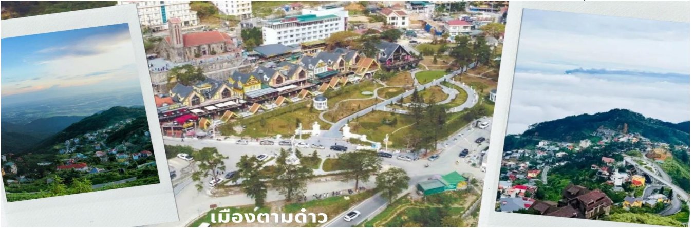
เมืองตามด้าว

สงบ ธรรมชาติอุดมสมบูรณ์ เหมาะกับคนที่อยากหนีร้อนจากในเมืองมาพักผ่อนชิลๆ และที่นี้ยังถูกเรียกว่า Little Sapa และ ดาลัดแห่งภาคเหนือ เนื่องจากเป็นเมืองกลางสายหมอกในหุบเขา และมีความเป็นยุโรปคล้ายกับซาปา