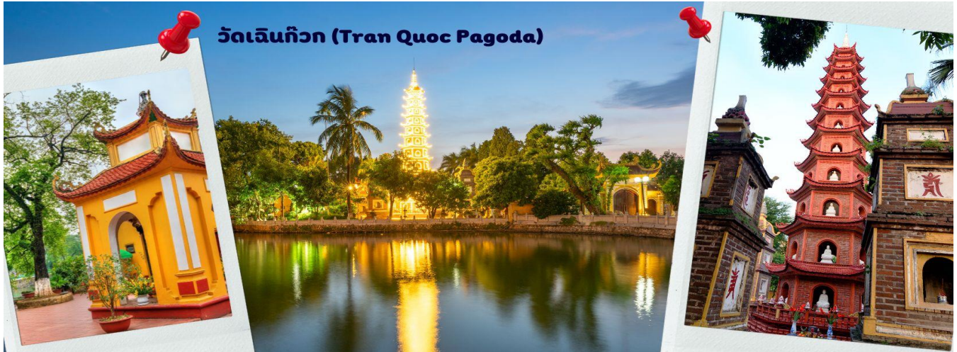
วัดเงินทิว (Tran Quoc Pagoda)

สมควรแก่เวลา นำท่านเดินทาง สู่ท่าอากาศยานนานาชาติฮานอย เตรียมตัวเดินทางสู่กรุงเทพฯ