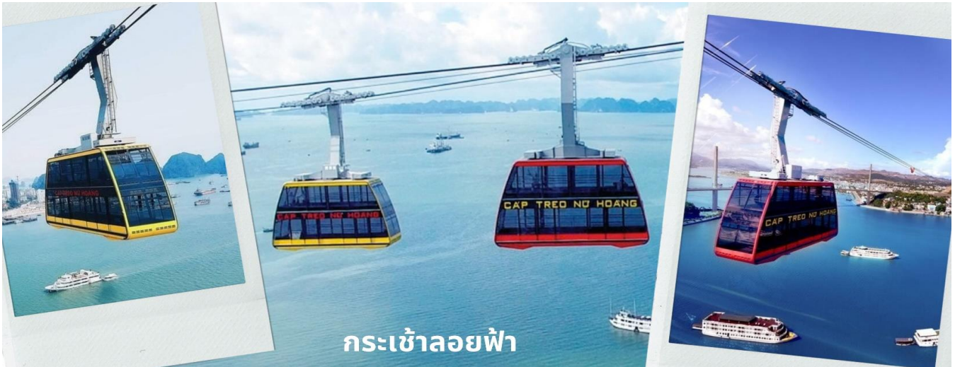
กระเช้าลอยฟ้า

จากนั้นนำท่านนั่ง Queen Cable Car กระเช้าลอยฟ้า 2 ชั้นที่ใหญ่ที่สุดในโลก จุคนได้มากถึง 250 คนต่อเที่ยว สามารถรับ-ส่งผู้โดยสารได้มากถึง 2,000 คนต่อชั่วโมง กระเช้าลอยฟ้า 2 ชั้นยิ่งใหญ่อลังการนี้เป็นส่วนหนึ่งของสวนสนุก Sun World Halong Park สร้างโดย Doppelmayr/Garaventa Group จากประเทศสวิตเซอร์แลนด์และออสเตรีย โดยมีความพิเศษที่สามารถทำลายสถิติโลก และได้รับการบันทึกลงใน Guinness World Records ถึง 2 รายการ คือ เป็นกระเช้าที่จุคนได้มากที่สุดในโลก และมีเสาคอนกรีตส่งกระเช้าที่สูงที่สุดในโลก ด้วยความสูงถึง 188.88 เมตร