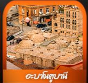
อะบานิตูบานี