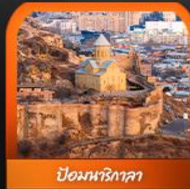
ป้อมนารีกาลา