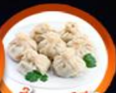
เกี้ยวจอร์เจีย Khinkali