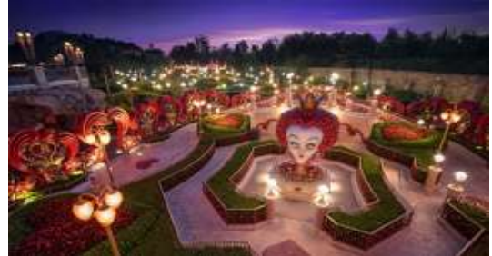
"Fantasyland" เรื่องราวจากเทพนิยายและตัวละครดิสนีย์ จะกลายเป็นเครื่องเล่นที่หนักท้อเที่ยวได้สนุกสนาน โดยเฉพาะ 'Seven Dwarfs Mine Trains' เป็นเครื่องเล่นรถไฟเหาะโลกใต้