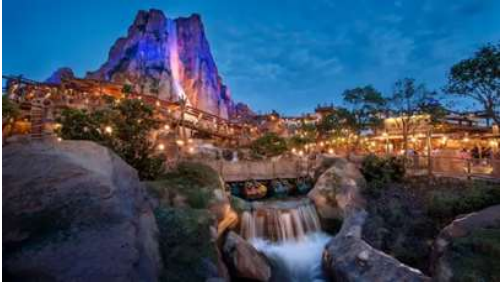
"Adventure Isle" ดินแดนให้การผจญภัยที่จะทำให้หนักท้อเที่ยว ได้ตื่นตาตื่นใจกับบรรยากาศหุบเขาลึกลับในยุคดึกดำบรรพ์

09.00 น. นำท่านเดินทางสู่ Shanghai Disneyland สวนสนุกแห่งที่ 6 ของอาณาจักรดิสนีย์มีขนาดใหญ่ อันดับ 2 ของโลก ตั้งอยู่ในเขตฉงชาน ใกล้กับแม่น้ำหวงผู่ และสนามบินผู้โดยสารปิดเครื่องเล่นหวาดเสียว และแล้วรวมความบันเทิงที่น่าสนใจ