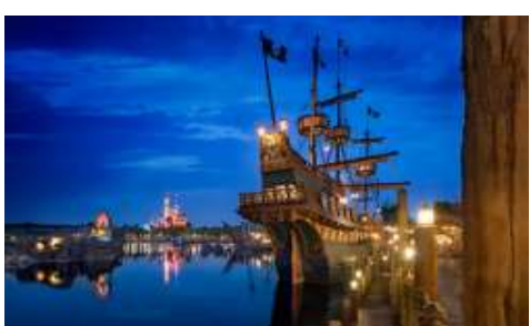
"Treasure Cove" สิ่งที่จะมีอยู่แห่งเดียวและแห่งใหม่บนโลก ในสวนสนุกดิสนีย์ในร่มจากจาก ภาพยนตร์ชื่อดัง The Pirates of the Caribbean กลายเป็นเครื่องเล่นและการแสดงไฮว์สุดตระการตา