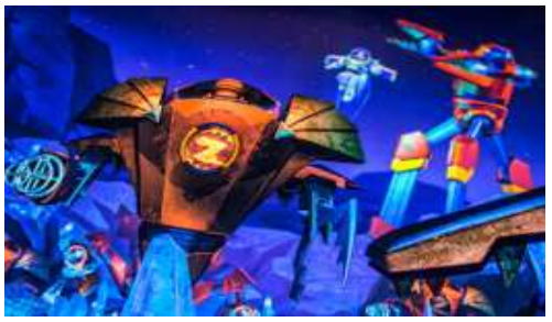
"Tomorrowland" อีกหนึ่งไฮไลท์เด่นของสวนสนุกดิสนีย์ที่ มักจะสร้างโลกแห่งอนาคตเพื่อสร้างจินตนาการให้กับเด็ก ๆ