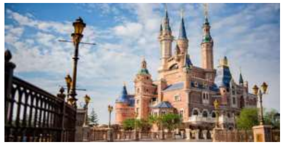
"Fantasy Land" สนุกกับเมืองเทพนิยาย ตระการตาและตัวการ์ตูน ที่ท่านชื่นชอบ อาทิเช่น สโนว์ไวท์, เจ้าหญิงนิทรา, ซินเดอเรลล่า, มิกกี้เมาส์, หมิวลูและเพื่อนๆตัวการ์ตูน อันเป็นที่ใฝ่ฝันของทุกคน

เที่ยง/ค่ำ... อีศระอาหารมือเที่ยง/ค่ำ เพื่อความสะดวกในการเที่ยวชม (ไม่รวมค่าบริการ) พักที่ HOTEL Shanghai Holiday Inn หรือเทียบเท่า