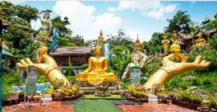
วัดสินชัย

*ทางบริษัทฯ ขอสงวนสิทธิ์ในการสลับโปรแกรมทัวร์ตามความเหมาะสมขึ้นอยู่กับสถานการณ์หน้างาน โดยคำนึงถึงผลประโยชน์ของลูกค้าเป็นสำคัญ