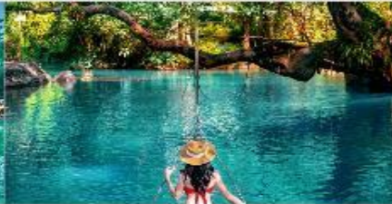
บูลลาทูน