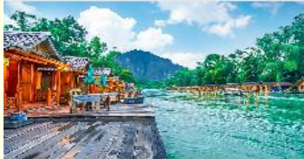
เมืองเพ็อง