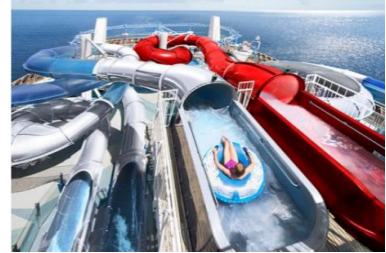
พักค้างแรมบนเรือสำราญ MSC BELLISSIMA