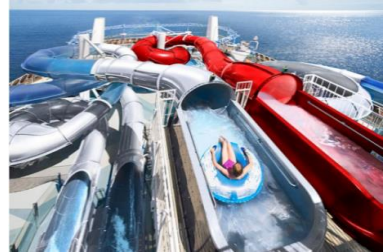
แพ็คเกจแรมบนเรือสำราญ MSC BELLISSIMA