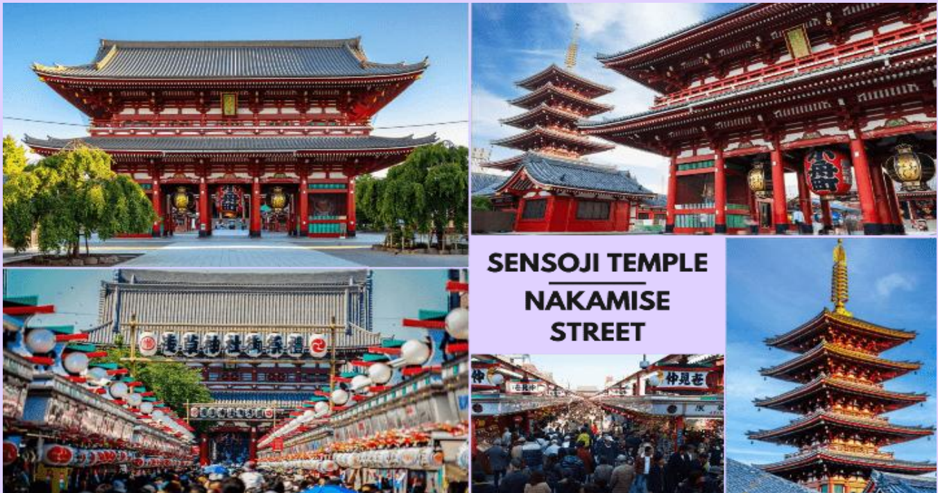
SENSOJI TEMPLE NAKAMISE STREET

07.55 น. ดินแดนทางถึง สนามบินนานาชาตินาริตะ ประเทศญี่ปุ่น (**เวลาที่ประเทศญี่ปุ่นจะเร็วกว่าประเทศไทย 2 ชม. ควรปรับนาฬิกาของท่านเพื่อสะดวกในการนัดหมาย) หลังผ่านพิธีตรวจคนเข้าเมืองแล้ว จากนั้นนำท่านสู่ เมืองโตเกียว (Tokyo) มหานครที่ใหญ่ที่สุดแห่งหนึ่งของเอเชีย และของโลก ประกอบด้วยแหล่งท่องเที่ยว แหล่งวัฒนธรรม ศูนย์รวมเศรษฐกิจ เทคโนโลยีทางด้านต่าง ๆ และสถานที่สำคัญทางศาสนา มากมายในมหานครแห่งนี้ที่ผสมผสานกันได้อย่างลงตัว นำท่านเดินทางสู่ วัดเซ็นโซจิ (Sensoji Temple) หรือที่รู้จักกันในนาม วัดอาซากุสะ เป็นวัดที่ขึ้นชื่อว่าเก่าแก่มากที่สุดของเมืองโตเกียวแห่งนี้ ถูกสร้างขึ้นเสร็จเมื่อประมาณปี ค.ศ. 645 เป็นหนึ่งในวัดที่เก่าแก่ และเป็นที่ยอมรับมากที่สุดวัดหนึ่งของเมืองโตเกียว บริเวณทางด้านหน้าวัดจะมี ถนนนากามิเสะ (Nakamise) เป็นถนนยาวเข้าสู่พื้นที่ภายในวัด เต็มไปด้วยร้านค้า ร้านอาหาร ร้านจำหน่ายของที่ระลึกต่าง ๆ มากมาย โดยนักท่องเที่ยวนิยมถ่ายภาพที่ระลึกกับโดมแดงอันใหญ่ ๆ ที่เปรียบเสมือนสัญลักษณ์สำคัญมาก ๆ ของวัดแห่งนี้ ให้ท่านได้ช้อปปิ้งเลือกซื้อสินค้าของขวัญของฝากจากญี่ปุ่น หรือเลือกซื้อเลือกชิมขนมท้องถิ่นอร่อย ๆ มากมายตามได้อริยาตัย