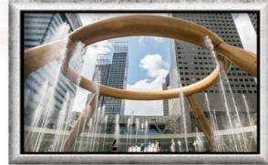
Fountain of Wealth