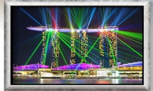
Wonder Full Light & Water Spectacular

เมนูพิเศษ! Bak Kut Teh 3 วัน 2 คืน 🍴 อาหาร : 3 มื้อ เดินทาง มี.ค. - ส.ค. 66